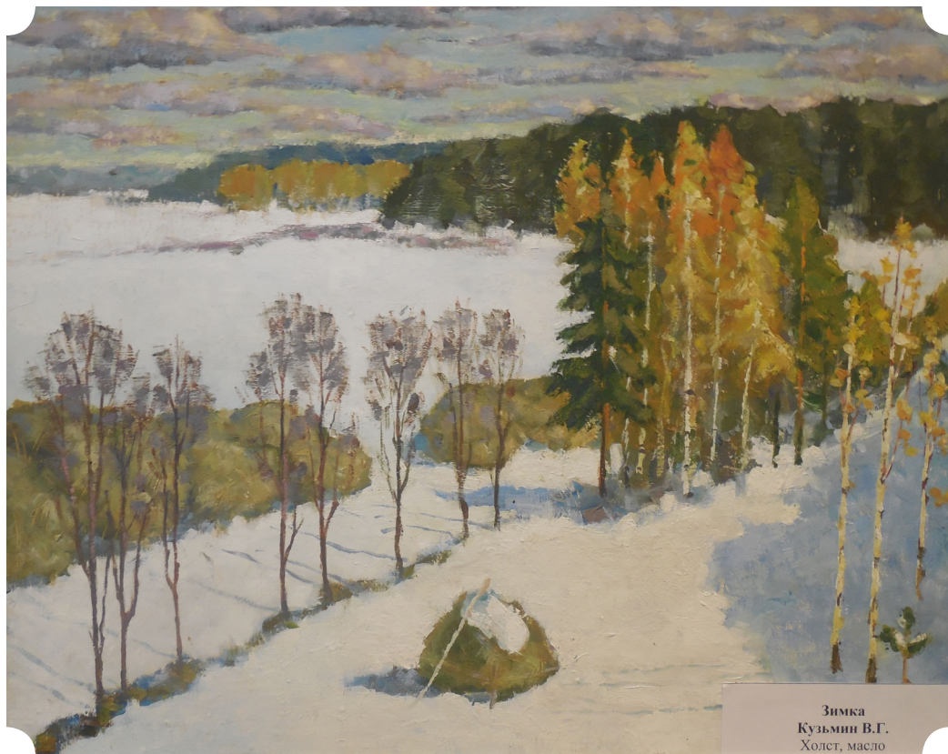
Зимка Кузьмин В.Г. Холст, масло